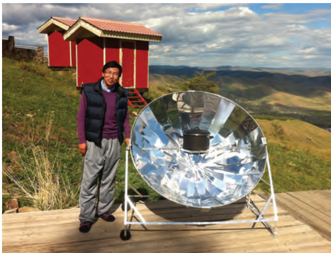
Mongolei, Bild Hans Wallner

Erste Versuche mit zwei Solarkochern SK14 von EG Solar verliefen positiv: Die Nomaden akzeptieren die Technik. Nun ist geplant, in der Bezirkshauptstadt Tsengel/Altai eine Werkstatt zum Bau von Solarkochern einzurichten und zwar im Daamal-Zentrum, einer Begegnungsstätte, die der Aus- und Weiterbildung der Tuva-Nomaden dient – sehr gute Voraussetzungen, um von dort aus das solare Kochen und Filzen zu verbreiten.