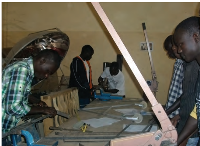
Solarkocherbaukurs bei ECOPROTECT

Die Turbulenzen rund um die Präsidentschaftswahlen im Senegal brachten in 2012 auch für die Projektarbeit unseres Partners ECOPROTECT Erschwernisse und Verzögerungen. Ein Streik der Professoren legte längere Zeit den Universitätsbetrieb in St. Louis lahm; entgegen der Zusage des damaligen Rektors musste der Raum für die Solarkocherwerkstatt mit anderen studentischen Gruppen geteilt werden; einige aktive Studenten, die neu in den Vorstand von ECOPROTECT gewählt worden waren, wechselten an Universitäten in Frankreich. Schließlich trat eine Phase der Konsolidierung ein. Der neue Rektor zeigt mehr Bereitschaft, das Projekt ECOPROTECT voran zu bringen und einen eigenen Raum für die Solarkocherwerkstatt zur Verfügung zu stellen.