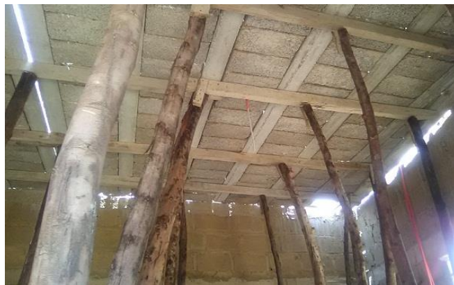
Die vorgefertigten Träger und Betonsteine für die Decke

Im August erzwang die Regenzeit einige kurze Pausen, bevor die Bodenplatte und später die Decke aufgebracht werden konnte. Man wollte ja stabil und nachhaltig bauen.