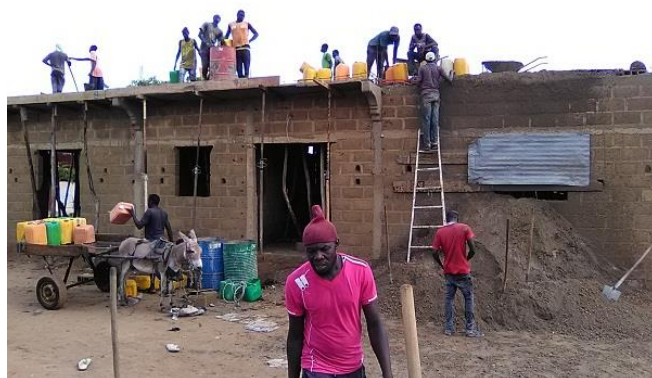
Die Betondecke wird betoniert

Wie kooperativ und mit wieviel Eigenleistung die Mitglieder von SAPOP beim Bau zusammen halfen ist auf diesen Bildern zu sehen.