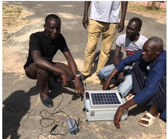
Teilnehmer mit dem "Solarfunktionskoffer"