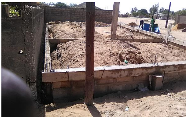
Das Fundament wurde gemauert und betoniert