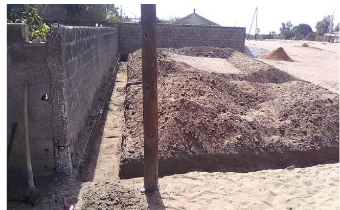
Das Fundament wurde ausgehoben

Nun folgten zügig die vertraglichen Vereinbarungen zwischen EG Solar und REDCHAIRity, inhaltliche Erklärungen in Französisch an SAPOP, Bauplan mit Kostenplan für die einzelnen Bauabschnitte, Nachweise über die rechtmäßige Verwendung des Baugrundstückes etc. Als Ziel für die Vollendung des Baus wurde der 31. Dezember 2017 festgehalten. Sofort nach Erhalt der ersten Teilsumme Anfang Juni begann SAPOP die Bauarbeiten: