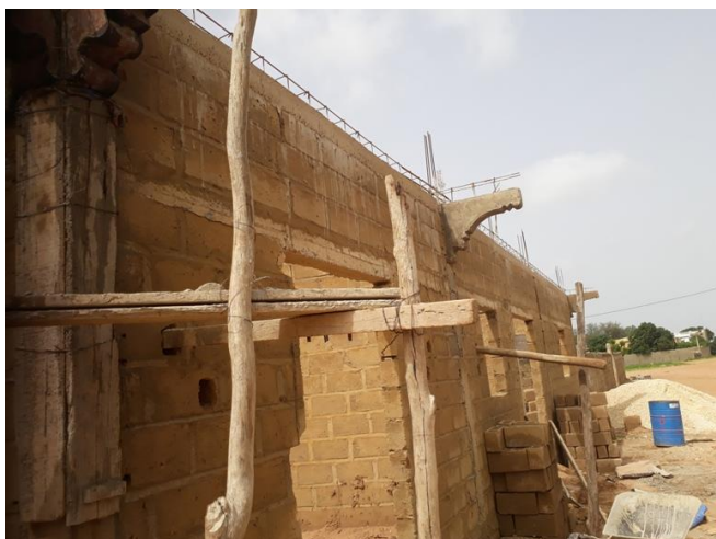
Die Außenfront des entstehenden Werkstattgebäudes

Im August erzwang die Regenzeit einige kurze Pausen, bevor die Bodenplatte und später die Decke aufgebracht werden konnte. Man wollte ja stabil und nachhaltig bauen.