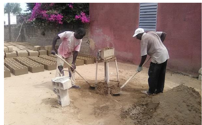
Herstellung der Hohlblockbetonsteine

EG-Solar e.V. * Neuöttinger Str. 64 c * 84503 Altötting * Tel. (0 86 71) 96 99 37