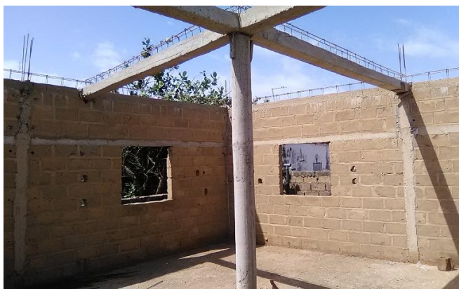
Die tragende Konstruktion für die Betondecke