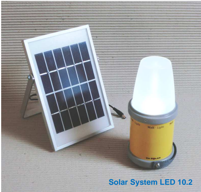
Solar System LED 10.2